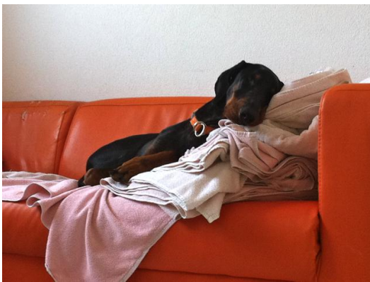
Tante Blia wärmt die Decken schon mal vor...