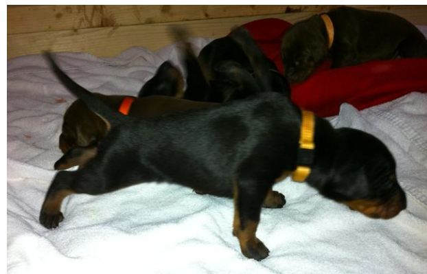
Das Laufen geht immer besser!