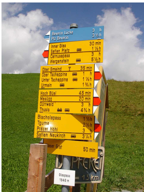
Wanderwege rund um den Glaspass.