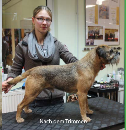
Nach dem Trimmen